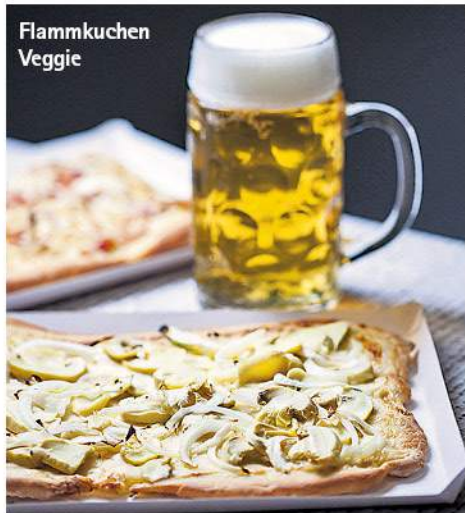
Leo Laps Divulgação