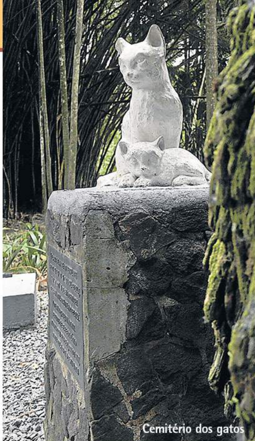
Cemitério dos gatos

Um dos pontos turísticos mais inusitados de Blumenau, o Cemitério dos Gatos fica no Centro da cidade, perto do Museu da Cerveja. A doadora de grande parte do patrimônio museológico de Blumenau, Edith Gaertner, tinha vários gatos de estimação e quando eles morriam, ela fazia questão de sepultá-los nos fundos do terreno de casa. Atualmente há no local nove túmulos, mas já teve 50 sepulturas. O espaço fica no mesmo terreno do Museu de Hábitos e Costumes, outro passeio que vale a pena ser feito na cidade.