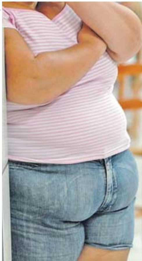
FABRIZIO MOTTA, BD

No ritmo atual, em 10 anos 30% da população estará acima do peso adequado, mesmo índice dos Estados Unidos, onde a obesidade é hoje um grave problema de saúde pública. Na raiz dessa epidemia estão o sedentarismo e uma alimentação rica em açúcares e gorduras e pobre em nutrientes. Segundo a última Pesquisa de Orçamento Familiar (POF), realizada pelo IBGE entre 2002 e 2003, os brasileiros estão substituindo o tradicional arroz e feijão por comida pronta ou processada. Para complicar, apenas 10,2% da população com 14 anos ou mais se exercita regularmente.