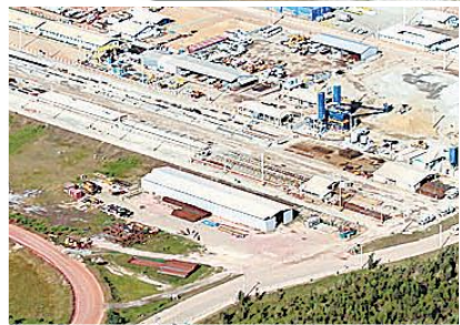
Obras do complexo começaram em outubro de 2007