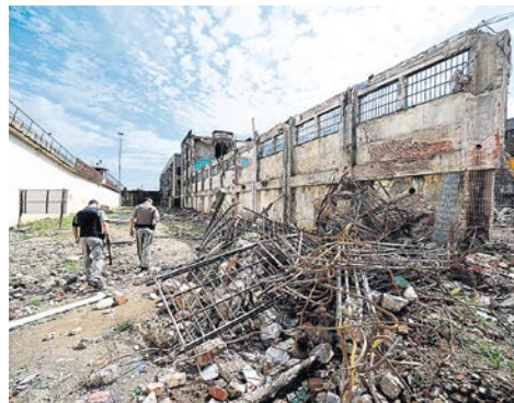
ROMALO BERNARDI, BD, 03/12/2014

CAOS NO CENTRAL Fórum formado por entidades gaúchas envia representação contra o país, que poderá ser condenado por corte internacional CAOS NO CENTRAL Fórum formado por entidades gaúchas envia representação contra o país, que poderá ser condenado por corte internacional