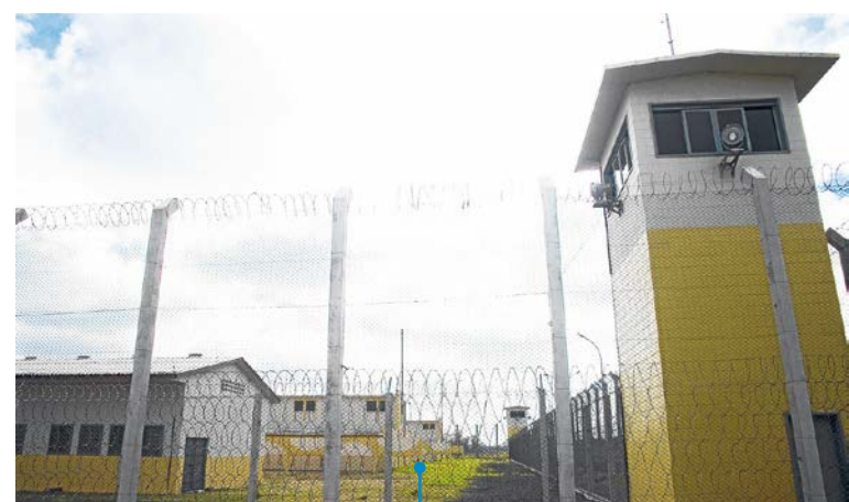
ALVARO PESQUERARO, ESPECIAL

Custo: R$ 21,6 milhões. Vagas: 529. O Judiciário determinou a destinação de 200 vagas para presos do Central. O restante será ocupado por detentos da região. Situação: pronta. Aguarda posse de agentes penitenciários. Deve ser ocupada ainda em dezembro.