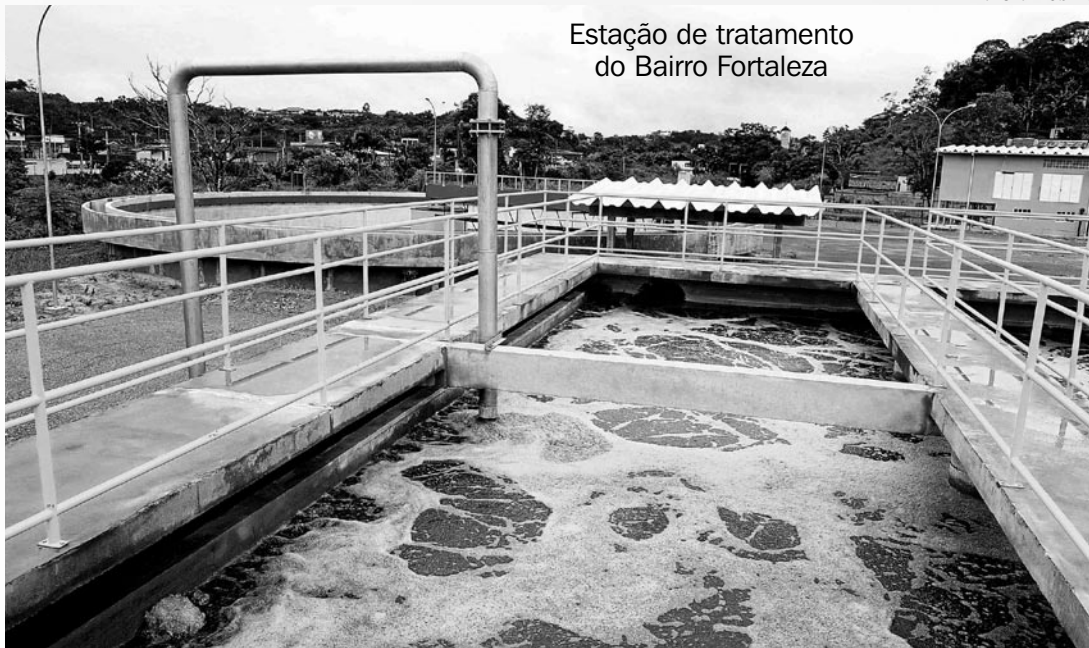
Estação de tratamento do Bairro Fortaleza