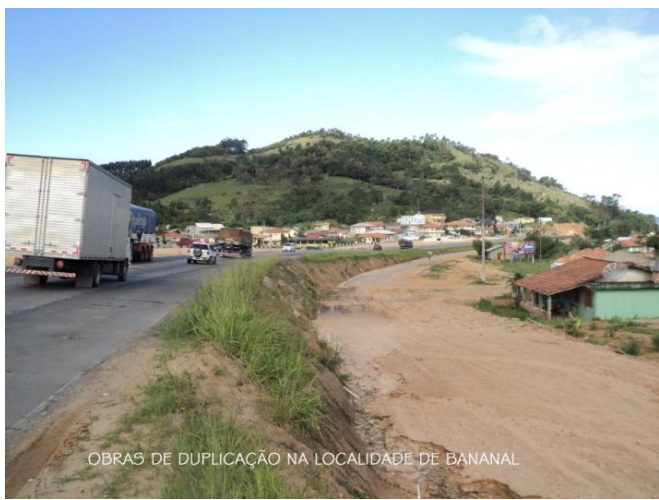
OBRAS DE DUPLICAÇÃO NA LOCALIDADE DE BANANAL