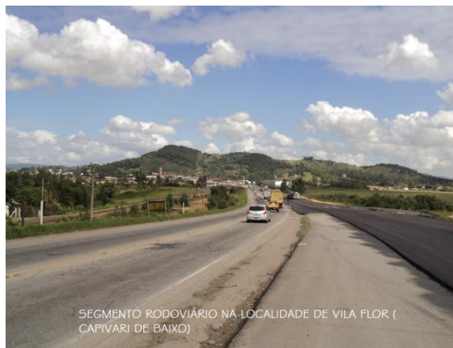
SEGMENTO RODOVIÁRIO NA LOCALIDADE DE VILA FLOR ( CAPIVARI DE BAIXO)