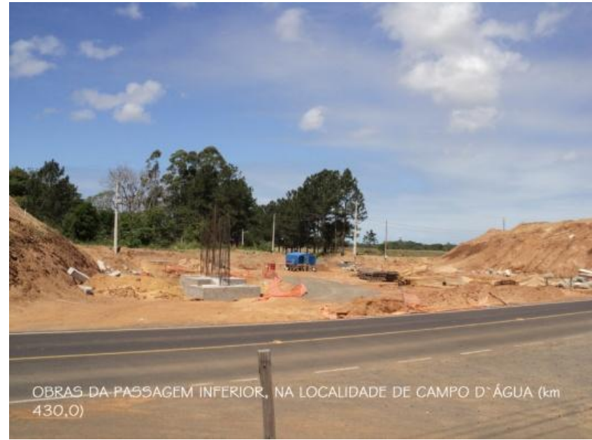
OBRAS DA PASSAGEM INFERIOR, NA LOCALIDADE DE CAMPO D'ÁGUA (km 430,0)