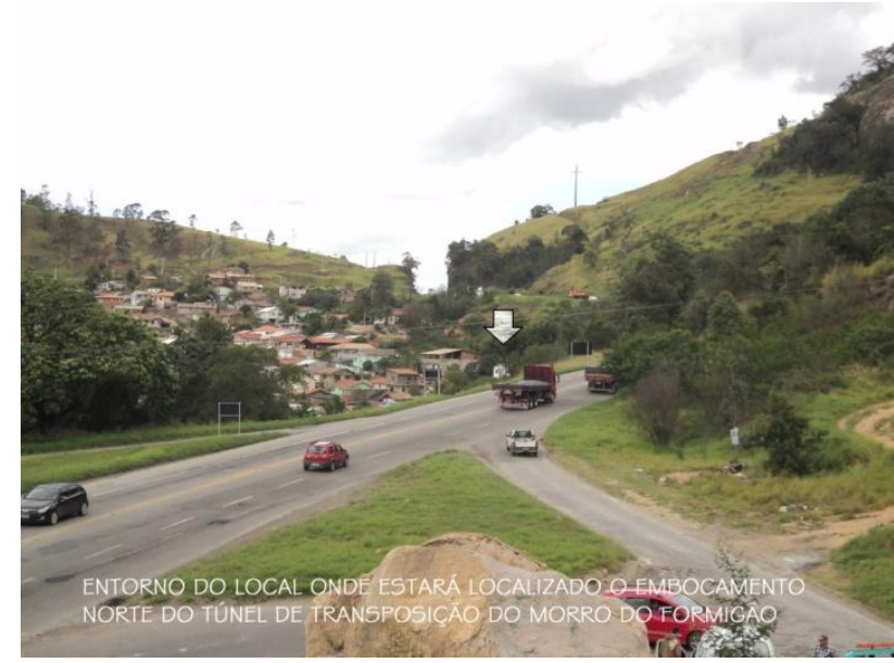
ENTORNO DO LOCAL ONDE ESTARÁ LOCALIZADO O EMBOCAMENTO NORTE DO TÚNEL DE TRANSPOSIÇÃO DO MORRO DO FORMIGÃO