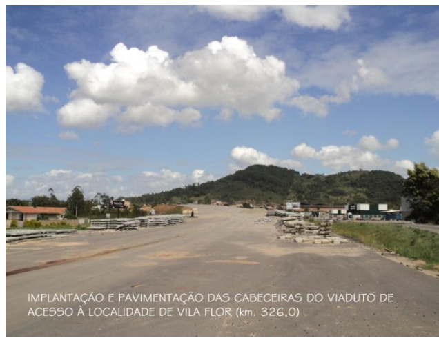
IMPLANTAÇÃO E PAVIMENTAÇÃO DAS CABECEIRAS DO VIADUTO DE ACESSO À LOCALIDADE DE VILA FLOR (km. 326,0)