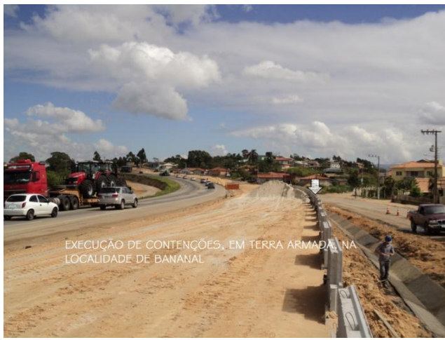
EXECUÇÃO DE CONTENÇÕES, EM TERRA ARMADA, NA LOCALIDADE DE BANANAL