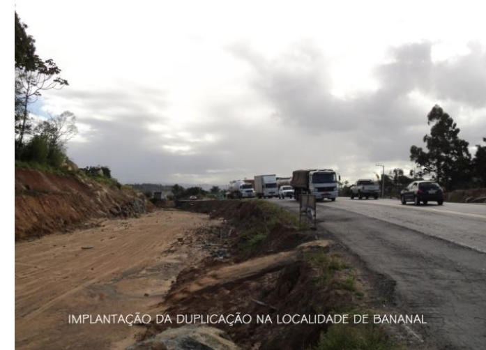
IMPLANTAÇÃO DA DUPLICAÇÃO NA LOCALIDADE DE BANANAL