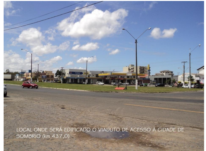
LOCAL ONDE SERÁ EDIFICADO O VIADUTO DE ACESSO À CIDADE DE SOMBRIO (km 437,0)