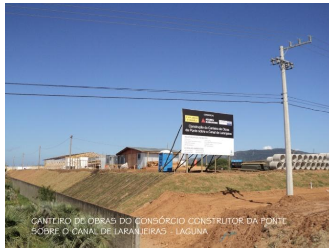
CANTEIRO DE OBRAS DO CONSÓRCIO CONSTRUTOR DA PONTE SOBRE O CANAL DE LARANJEIRAS - LAGUNA