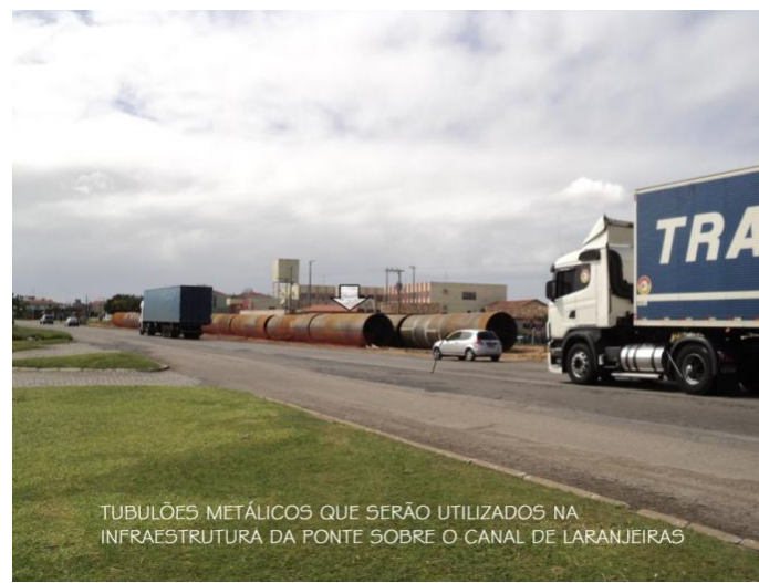
TUBULÕES METÁLICOS QUE SERÃO UTILIZADOS NA INFRAESTRUTURA DA PONTE SOBRE O CANAL DE LARANJEIRAS