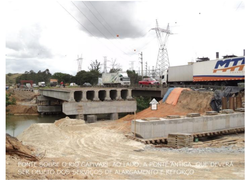
PONTE SOBRE O RIO CAPIVARI. AO LADO, A PONTE ANTIGA, QUE DEVERÁ SER OBJETO DOS SERVIÇOS DE ALARGAMENTO E REFORÇO