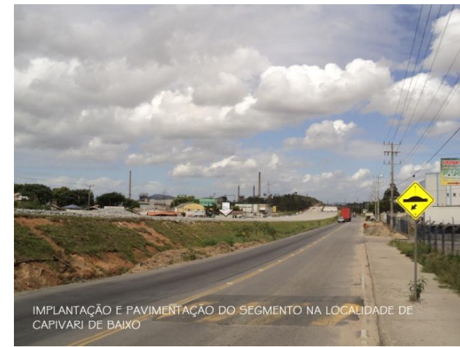
IMPLANTAÇÃO E PAVIMENTAÇÃO DO SEGMENTO NA LOCALIDADE DE CAPIVARI DE BAIXO