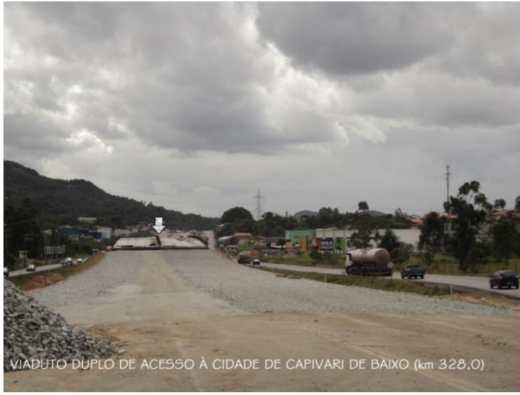
VIADUTO DUPLO DE ACESSO À CIDADE DE CAPIVARI DE BAIXO (km 328,0)