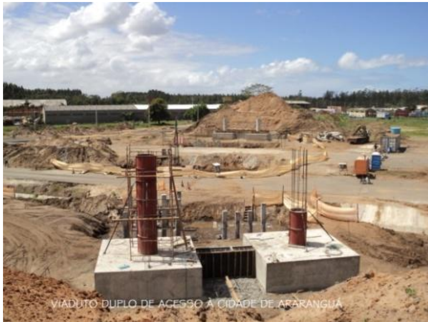
VIADUTO DUPLO DE ACESSO À CIDADE DE ARARANGUÁ