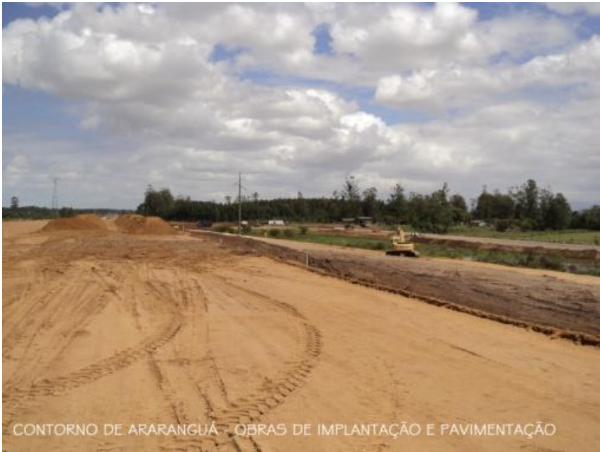
CONTORNO DE ARARANGUÁ - OBRAS DE IMPLANTAÇÃO E PAVIMENTAÇÃO