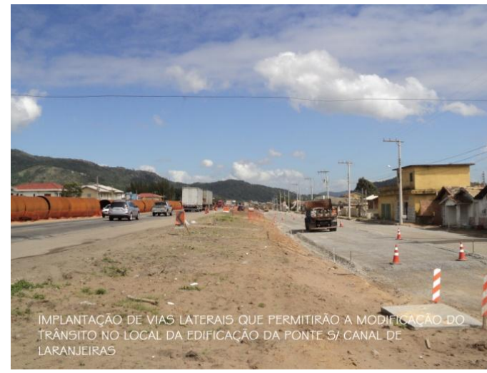
IMPLANTAÇÃO DE VIAS LATERAIS QUE PERMITIRÃO A MODIFICAÇÃO DO TRÂNSITO NO LOCAL DA EDIFICAÇÃO DA PONTE S/ CANAL DE LARANJEIRAS