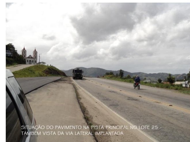
SITUAÇÃO DO PAVIMENTO NA PISTA PRINCIPAL NO LOTE 25 - TAMBÉM VISTA DA VIA LATERAL IMPLANTADA