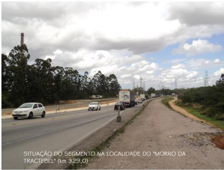
SITUAÇÃO DO SEGMENTO NA LOCALIDADE DO "MORRO DA TRACTEBEL" (km 329,0)