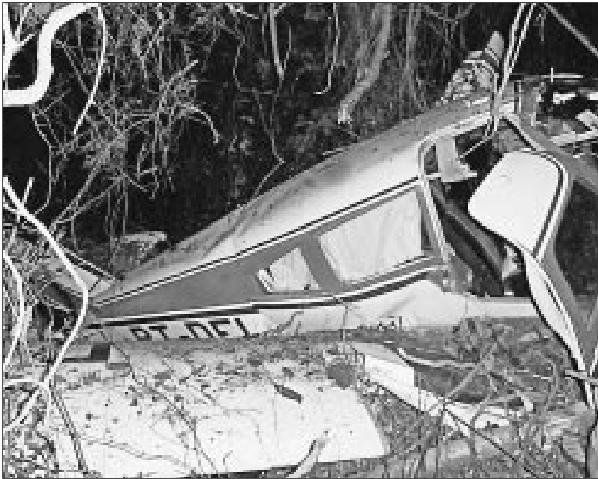
Desastre na Serra: o choque com o morro destruiu o bico do monomotor e deixou retorcidas as asas da aeronave