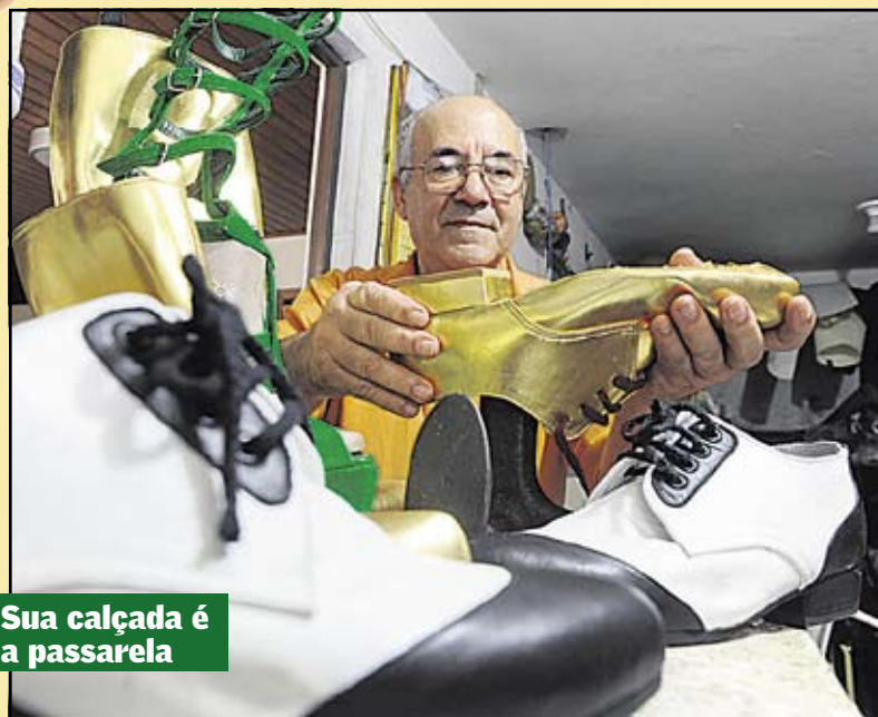
Sua calçada é a passarela