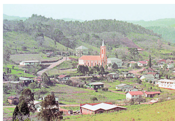
CRIBELE VIEIRA, RD