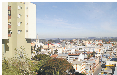
ALMIR DUPONT, BD