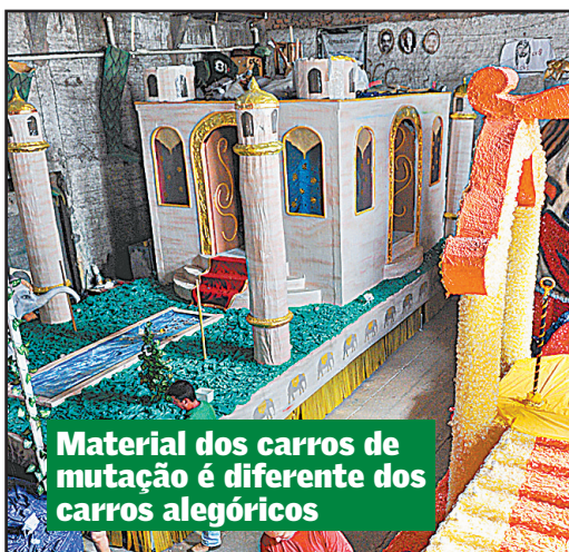
Material dos carros de mutação é diferente dos carros alegóricos